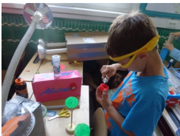
Ieder zijn talent