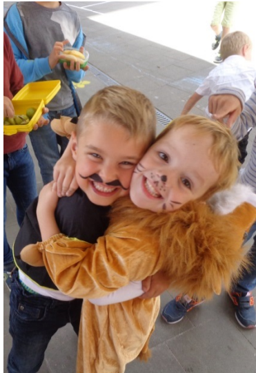
Je hoort erbij, zoals je bent