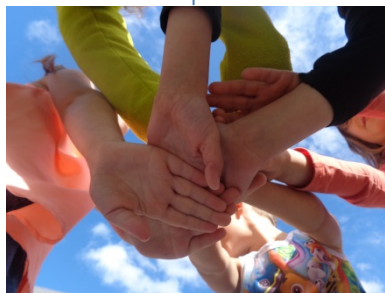
Samen zijn we sterk